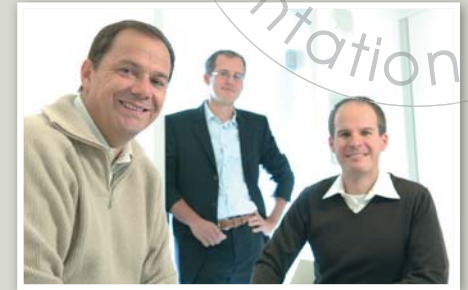
Praxis für Zahnheilkunde "Post am Lech", Tagesklinik

Hansemannstr. 10 41468 Neuss Tel. +49 (0)21 31 - 2012-0 Fax +49 (0)21 31 - 2012-222 Email: info@meisinger.de Internet: www.meisinger.de